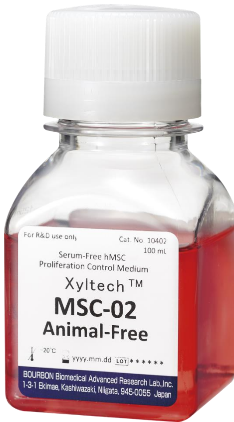
Xyltech™ MSC-02 Animal-Free